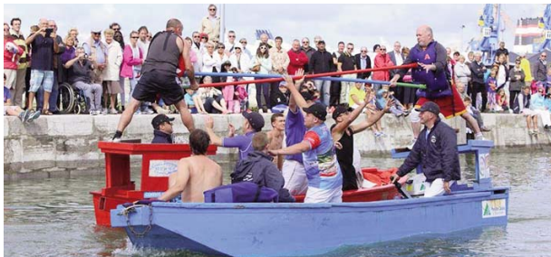
Joutes nautiques à l'occasion de la Fête du Courgain maritime