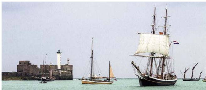
Parade des voiliers traditionnels lors de La Côte d'Opale fête la mer

Grande procession de Notre Dame de Boulogne , ce pèlerinage historique célèbre l'arrivée par la mer d'une statue de la vierge : procession aux flambeaux, du port jusqu'à l'église Saint-Pierre (le 29 à 20h) et procession en costumes traditionnels jusqu'à la cathédrale (le 30 à 15h30).