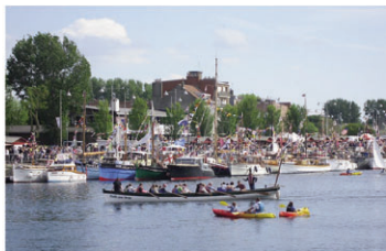
75 ème anniversaire de l'opération Dynamo

Le week-end est l'occasion de célébrer l'univers maritime sous toutes ses formes : baptêmes nautiques, démonstrations, portes ouvertes au Musée portuaire... Animations en accès libre autour du bassin du Commerce.