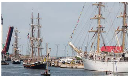
Grands voiliers lors d'Escales à Dunkerque F.Bertout

Rejoignez l'équipage de la Fédération Régionale pour la Culture et le Patrimoines Maritimes: adhésion individuelle 30 € - personne morale 60 € - valable 1 an et déductible fiscalement -