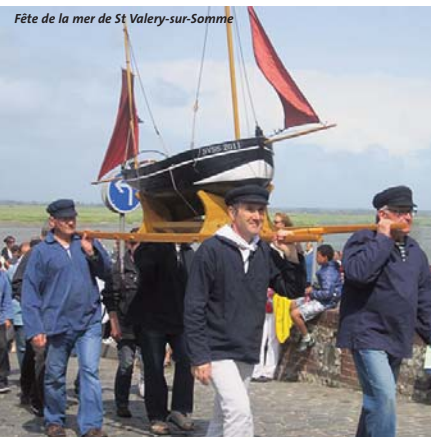
Fête de la mer de St Valery-sur-Somme

Fête de la Mer , arrivée des bateaux en matinée, village d'animations, expositions et chants de marin dans la journée.