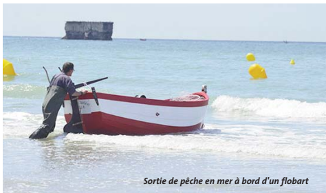
Sortie de pêche en mer à bord d'un flobart

Sorties de pêche en mer , embarquez à bord de la flottille de flobarts de l'association des Barsiers portelois, pour vous initier à la pêche aux maquereaux. Réservation auprès de l'office de tourisme, pour une ½ journée.