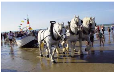
Traction de flobart lors de la fête de Wissant

Fête du flobart , Wissant célèbre la pêche traditionnelle et le bateau symbole du littoral boulonnais. Sur la place, village des traditions maritimes, dégustation vente de produits de la mer, artisanat maritime, concerts chants de marins, présentation de flobarts anciens, sur la plage, démonstrations de mise à l'eau, défilé de flobarts décorés dans les rues. Accès libre à partir de 10h.