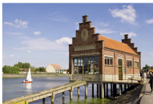
Maison de la Mer et Maison du Sauvetage Grand-Fort-Philippe.