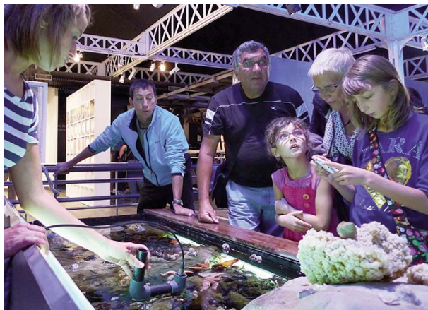
Atelier jeune public à Maréis

"Irving Couse, peintre photographe américain, Etaples 1893" permet de découvrir la vie du port d'Etaples à travers les photographies réalisées par cet artiste américain.