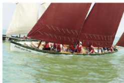
"Vole pour l'avenir"