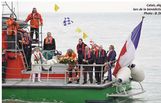
Calais, dépôt de gerbe lors de la bénédiction de la mer

Bénédition de la mer , la messe dans l'église du Courgain, est suivie d'une procession jusqu'au monument des sauveteurs et d'un rassemblement des bateaux dans l'avant-port pour une bénédiction et un dépôt de gerbes aux jetées.