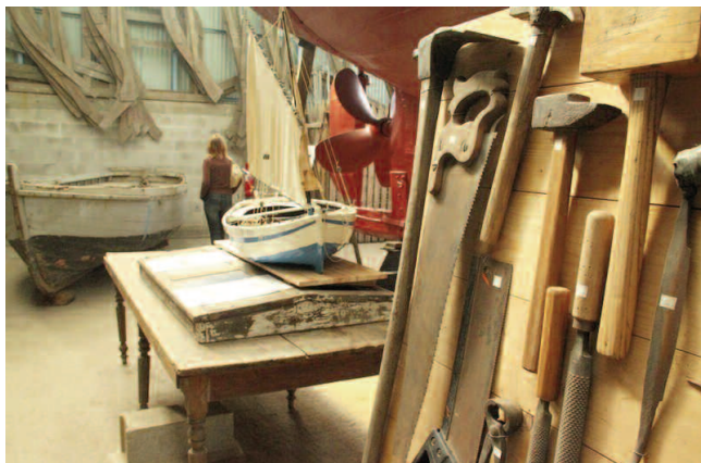
Chantier de construction navale traditionnelle