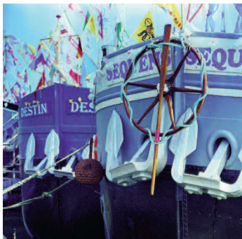
Pardon de la batellerie

St Omer (62) : Y'a full !!! Fête des maraîchers et des métiers du marais , pour marquer le début de la saison du chou-fleur, week-end festif avec visites du marais, rencontres, expositions, soirée musicale (le 24). Accès libre - ① lesfaiseursdebateaux.fr - 06.08.09.94.88