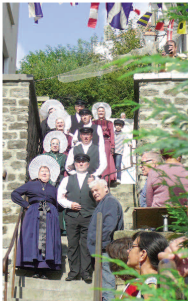
Fête de la Beurière, photo : S THIRIAT

Fête du hareng : Boulogne fête l'arrivée du poisson roi. Dégustation vente de hareng sous toutes ses formes, dans une ambiance musicale locale avec danses en costumes traditionnels boulonnais. Accès libre, port, 10h - 19h.