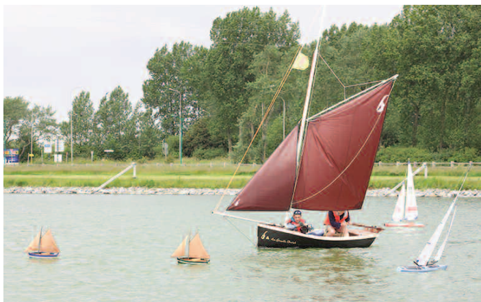
Rassemblement modélisme naval