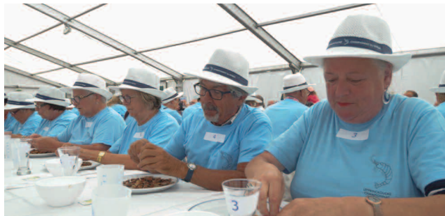
championnat du monde de décorticage de crevettes grises

Pêche à la crevette , équipé de votre matériel, venez-vous initier à la pêche à la crevette ou participer au concours. Les crevettes seront ensuite cuites sur place pour être dégustées. : www.zuydcoote.f