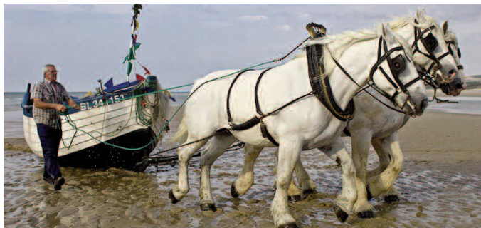
Wissant Fête du flobart