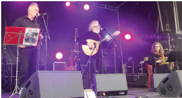
Le groupe Bloodland Trio