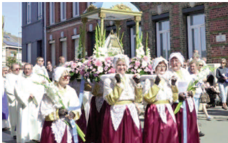
Bénédition de la mer

Bénédition de la mer , procession de Notre Dame des Dunes, portée par les bazennes, femmes des pêcheurs, en costumes traditionnels. A 16h, départ de la petite chapelle jusqu'au quai des Anglais où se déroule la bénédiction. Elle est suivie d'une sortie des bateaux pour un dépôt de gerbe en mer.