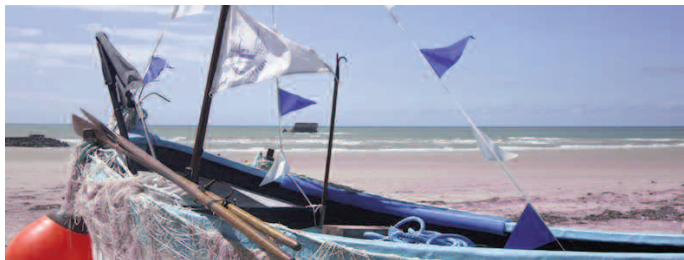
Le fort de l'Heurt depuis la plage

Visite d'ARGOS , lieu d'exposition permanente sur la radiomaritime installé dans les anciens locaux de Boulogne Radio (Cap d'Alprech), les visites sont proposées par des professionnels de la radiomaritime qui font revivre son histoire et ses évolutions. Visite gratuite mercredi et samedi de 14h30 à 17h.