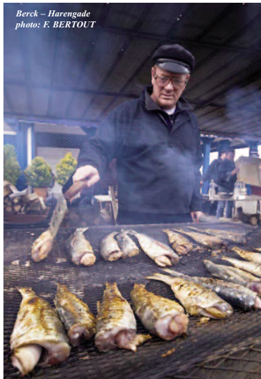
Berck - Harengade

Procession de Bavémont , dans le cadre du pèlerinage de St Josse (du 4 au 12 juin), cette neuvaine est le pèlerinage traditionnel des marins pêcheurs, qui portent la chasse de St Josse jusqu'à la chapelle de Bavémont. Départ à 9h30 de l'église. Le 8, procession à la source et messe à 19h.