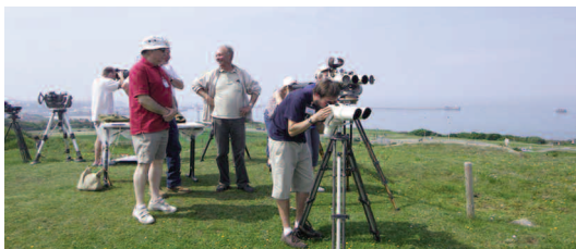
Wimereux, Vigilance bleue