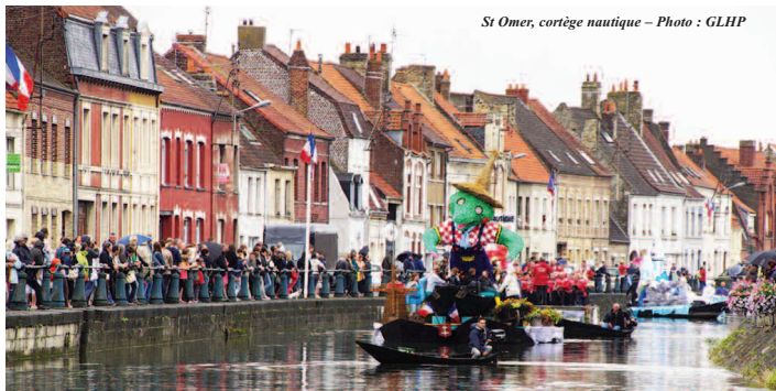
St Omer, cortège nautique