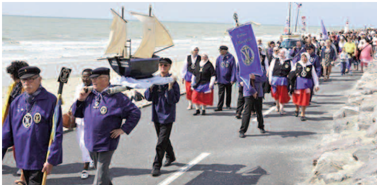
Berck, bénédiction de la mer

Bénédictio de la mer : dans l'après-midi, procession au départ de l'église ND des Sables vers le calvaire des marins, bénédiction des bateaux, suivie d'une messe en plein air à la base nautique et de la bénédiction, animation par des stands associatifs, en soirée feu d'artifices.