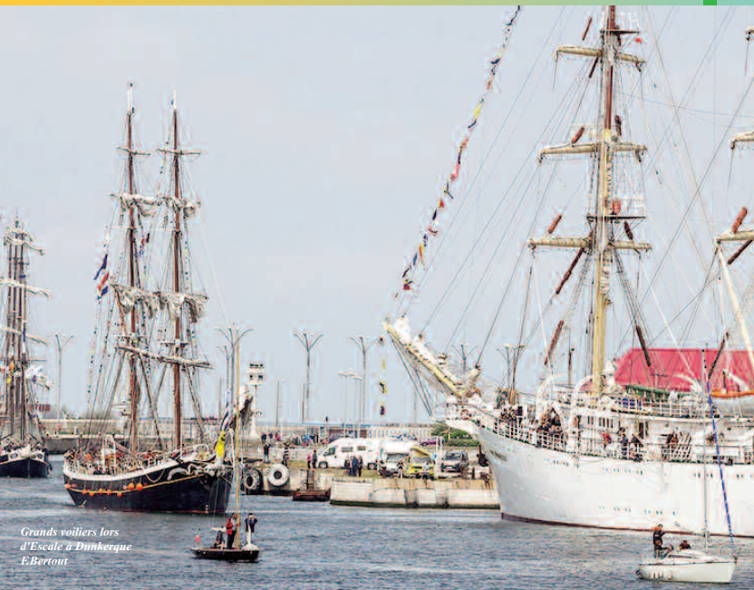
Grands voiliers lors d'Escale à Dunkerque E.Bertout

Rejoignez l'équipage de la Fédération Régionale pour la Culture et le Patrimoine Maritimes: