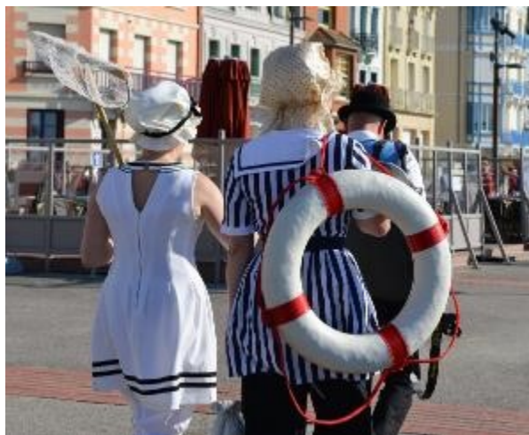
Ville de Mers-les-Bains

Fête des baigneurs , le temps d'un week-end, retour à la Belle Epoque, celle des bains de mer et des villas : parades en costumes, jeux traditionnels, reconstitution de bain de mer, visites commentées, conférence.... 📞 : Office de tourisme 02.27.28.06.46 – www.ville-merslesbains.fr