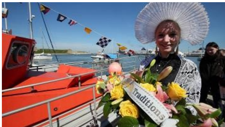
La Voix du Nord

Fête du Courgain maritime , la messe à l'église St Pierre-St Paul (10h) est suivie d'une procession vers le port. Dans le quartier du Courgain maritime, sont proposés animations, restauration à base de produits de la mer et concerts. Des joutes nautiques se déroulent dans le bassin Ouest de 15h30 à 17h30. Accès libre.