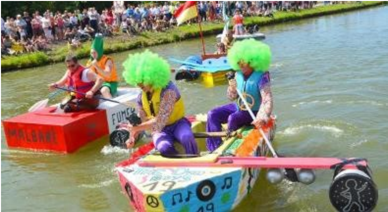
Office de tourisme Calais

Coulogne (62) : Course de baignoires , compétition amicale, ouverte à tous sur le canal entre les deux ponts. La baignoire est un composant obligatoire à la construction de l'engin flottant 📞 : Cercle d'aviron 06.82.76.34.47